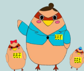
堺マザーズハローワーク就活ガーター ももず