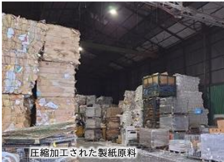
圧縮加工された製紙原料