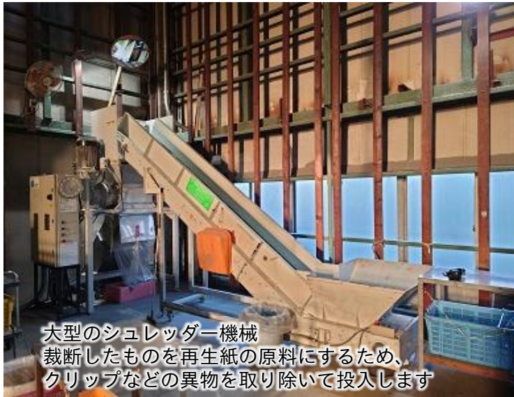
大型のシュレッダー機械 裁断したものを再生紙の原料にするため、 クリップなどの異物を取り除いて投入します

工場3階には大型のシュレッダーとHDDを裁断する機械があり、機密文書の裁断や機密メディアの切断破壊サービスを行っています。