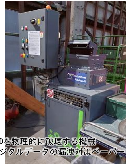
HDDを物理的に破壊する機械 デジタルデータの漏洩対策ペーパーレス化にも対応