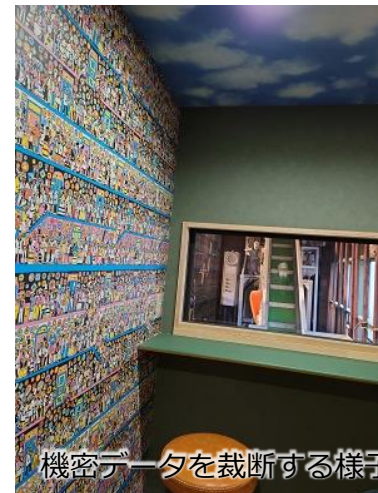
機密データを裁断する様子を見ることが出来る見学ルーム。