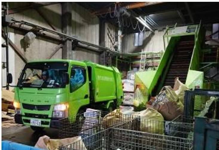
回収した古紙の搬入