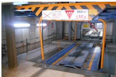
機械式立体駐車場(一例)