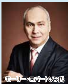
モーリー・ロバートソン氏