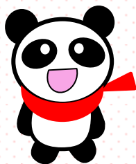
ハローワーク梅田 マスコットキャラクター 「梅パンダ」

JR北新地東出口すぐ OsakaMetro 谷町線東梅田8号出口5分 OsakaMetro 四ツ橋線西梅田3分 OsakaMetro 御堂筋線梅田8分 阪神線梅田6分/JR大阪7分 阪急梅田12分