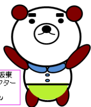
ハローワーク大阪東 マスコットキャラクター ひがしくん