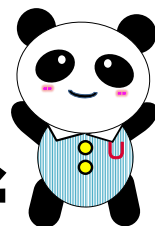
ハローワーク梅田 マスコットキャラクター うめパンダ