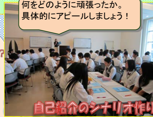
自己紹介のシナリオ作り