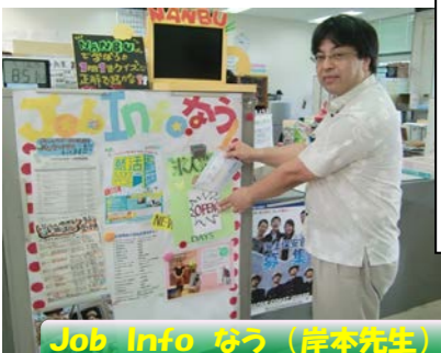
Job Info なう (岸本先生)

また、6月からは各クラスの生徒が作成した求人票公開までの「日めくりカレンダー」を教室の黒板横に掲示して、気持ちを高めていきました。7月からは、生徒や保護者へ、携帯電話・PCへの求人情報メール配信も行う予定です。生徒の進路は自分で考え、悩み、自分の将来の目標を見つけ、自ら行動することが大切です。就活はさせられるのではなく、自分から行動することです。