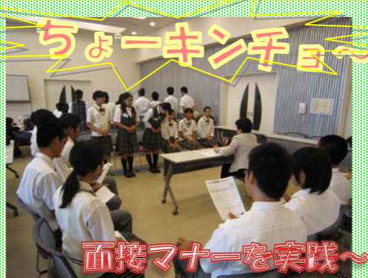
面接マナーを実践～

厚生労働省主催の「就職ガイダンス」が7月4日より開かれ、7日間で514名の生徒が参加しました。このガイダンスは、就職に必要なマナーとコミュニケーション能力を身に付け、模擬面接を体験するプログラムで、生徒一人ひとりが就職意識を高める良い機会になったと思います。学校教諭からは次回も参加したいと好評でした。又、他に講師からは、社会人の心得として働き続けることの大切さ、理想とおりがなくても継続すればやりがいにつながるという話を伝えられ、生徒自身、働くことに対し、意識がさらに深まったようです。