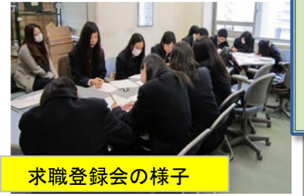
求職登録会の様子