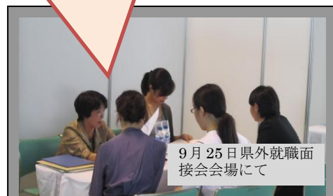
9月25日県外就職面接会会場にて

私たちの病院では、保護者の方との面談を積極的に行っております。沖縄出身の方も定着して頑張っておりますよ!今年看護師試験に落ちた方へは、再受験へむけて家庭教師をつけて受験対策を行っております。 (辻村外科病院 馬場管理部長)