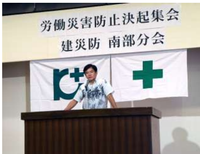
災害防止の取組を要請する星野署長