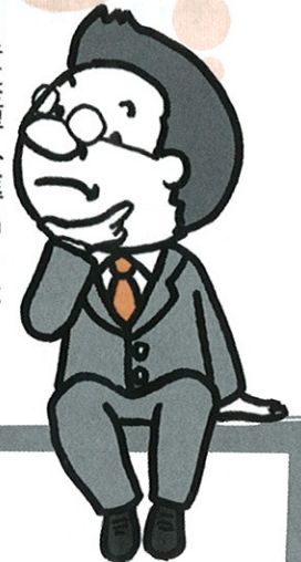
B工場長 異業種へ進出した