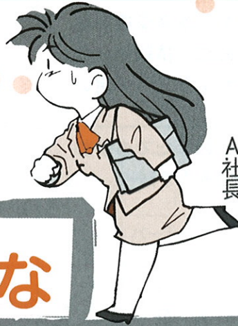
A社長 初めて人を雇った