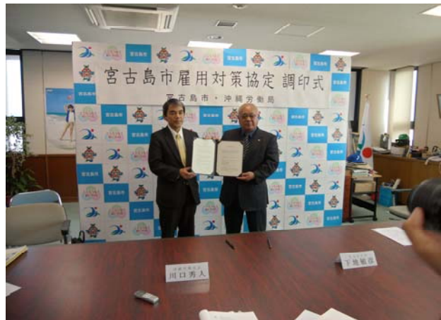
平成25年1月24日 宮古島市 市長室 宮古島市雇用対策協定 調印式（写真:左 川口秀人労働局長 右 下地敏彦市長）

平成25年1月24日、宮古島の雇用情勢の改善のため、沖縄労働局は、宮古島市と連携し、それぞれの施策を包括的、一体的な取組を実施するため「宮古島市雇用対策協定」を締結しました。