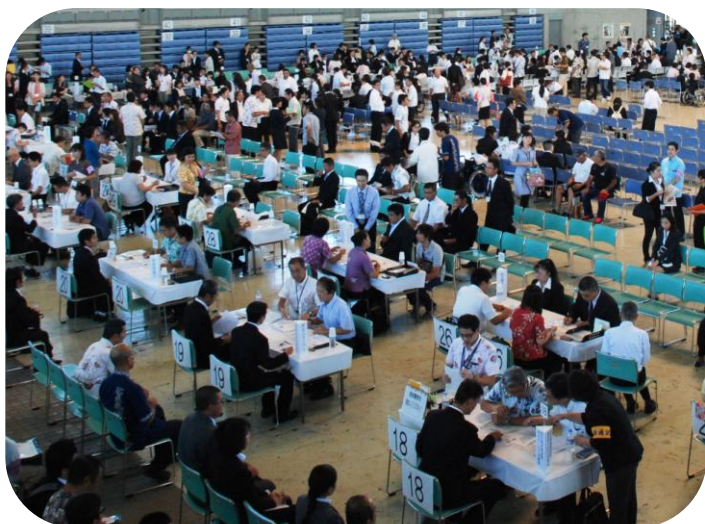
↑ 昨年の障がい者就職面接会の様子