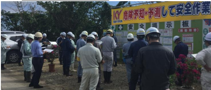
パトロール中の様子