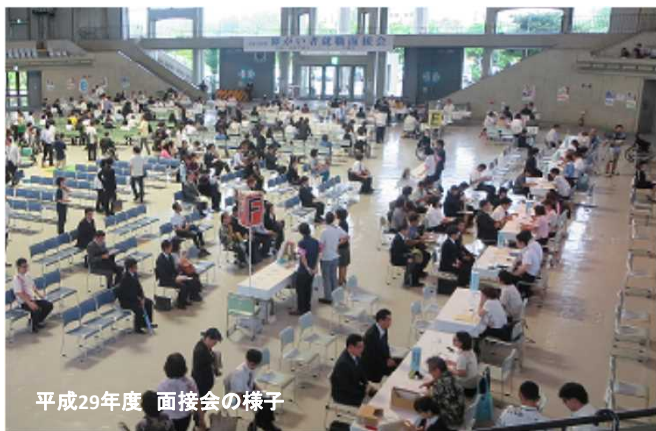
平成29年度 面接会の様子