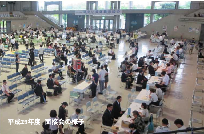
平成29年度 面接会の様子