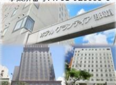
ルートイン那覇泊港 とまりん近く