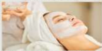
1.初心者でも基礎から学べるカリキュラム