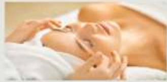
3.現役のエステティシャン講師が指導