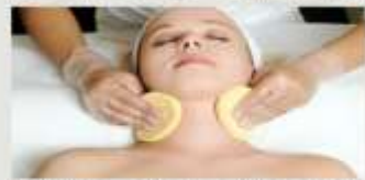
2.即戦力・対応力・接客力が身につく