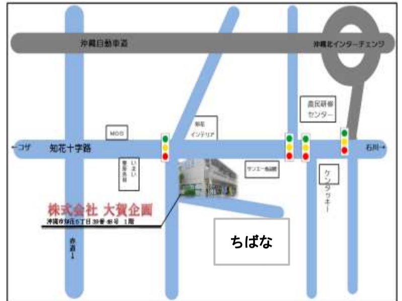
選考場所・実施施設の地図