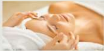
3.現役のエステティシャン講師が指導