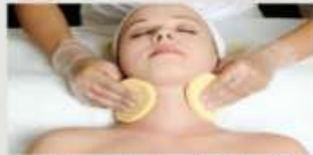
2.即戦力・対応力・接客力が身につく