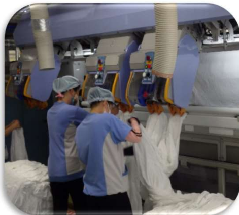
訓練実施場所 (宮古工場)