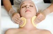
2.即戦力・対応力・接客力が身につく