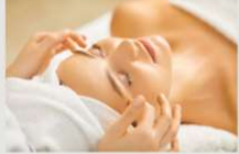
3.現役のエステティシャン講師が指導