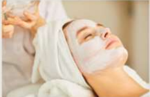
1.初心者でも基礎から学べるカリキュラム