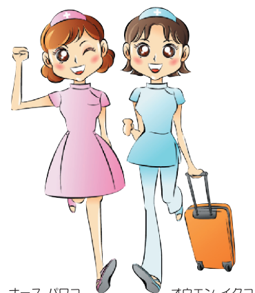
ナース パワコ オウエン イクコ