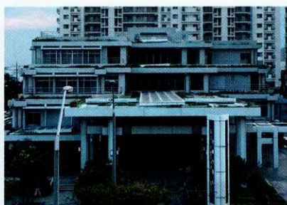
那覇第2地方合同庁舎