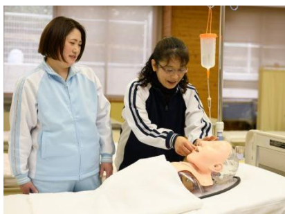
経管栄養のケア実習