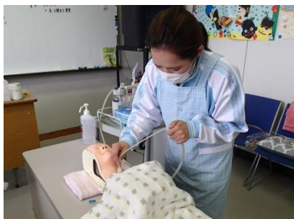
喀痰吸引のケア実習