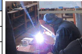
南部高等技術専門学校