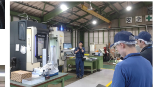
ポリテクセンター岡山