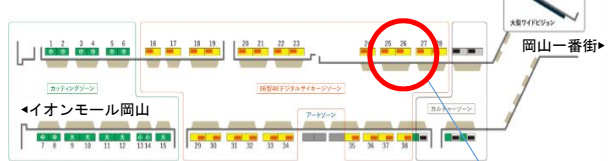
岡山駅南地下道 詳細図