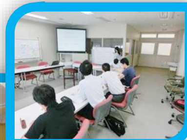
グループワークの一場面