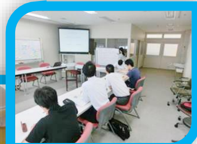
グループワークの一場面