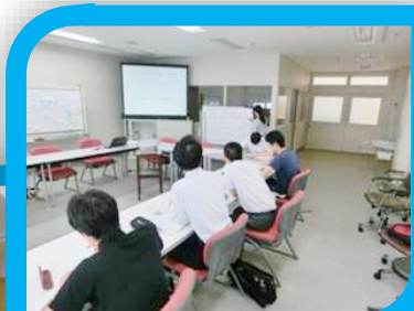
グループワークの一場面