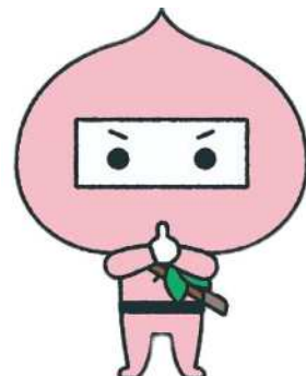
岡山働き方改革推進支援センター 公式キャラクター『ももにんにん』

会場 おかやま西川原プラザ 2階 大会議室 〒703-8258 岡山市中区西川原255