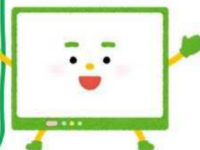
アナウンサーによるコメント読みの例（テレビ放送）

10月から、岡山県の最低賃金が時給982円 に、香川県の最低賃金が時給970円になりました。 事業主の方も 労働者の方も お互いに確認しましょう！ 事業主の方は、賃金引上げを支援する 各種助成金 の積極的な活用も！ 詳しくは岡山労働局又は香川労働局のホームページをチェック！