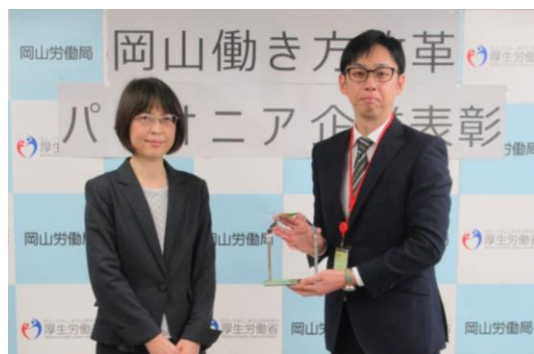
岡山労働局長 高田織物御 様