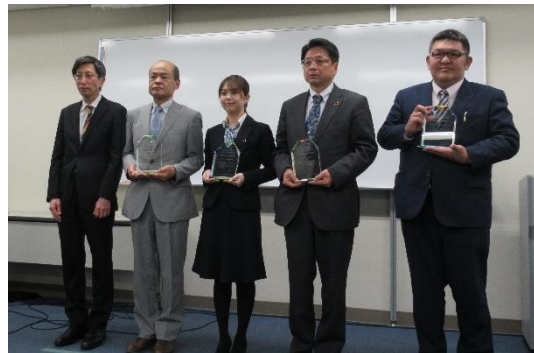
岡山労働局長 御アイリーフ御 様 グリーンツール御 様 御戸川木材御 様 御新見ソーラーカンパニー御 様

株式会社アイリーフ グリーンツール株式会社 株式会社戸川木材 株式会社新見ソーラーカンパニー