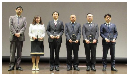
岡山労働局長 金田コーポレーション株式会社様 ナガオ株式会社様 日本キャストブル工業株式会社様 ヤンマーアグリ株式会社様 (旧ヤンマー農機製造株式会社) 株式会社WORK SMILE LABO様

金田コーポレーション株式会社 ナガオ株式会社 日本キャストブル工業株式会社 ヤンマーアグリ株式会社 (旧 ヤンマー農機製造株式会社) 株式会社WORK SMILE LABO