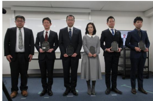
岡山労働局長 オーニット御 様 岡山大鵬薬品御 様 大和クレス御 様 御ナショナル発条御 様 御ミスターサービス御 様

オーニット株式会社 岡山大鵬薬品株式会社 大和クレス株式会社 株式会社ナショナル発条 株式会社ミスターサービス