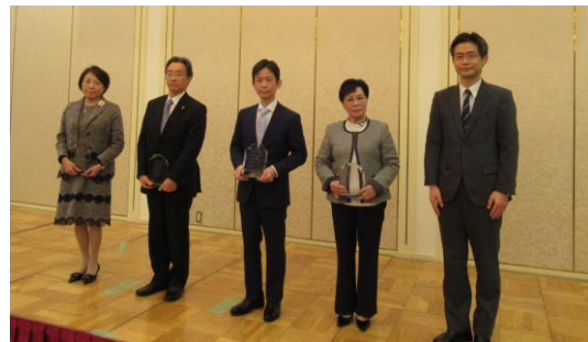
株式会社フジワラテクノアート様 (一財)淳風会様 倉敷木材株式会社様 株式会社英田エンジニアリング様 岡山労働局長

株式会社英田エンジニアリング 倉敷木材株式会社 一般財団法人淳風会 株式会社フジワラテクノアート