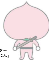
岡山働き方改革推進支援センター 公式キャラクター「ももにんにん」

※「事業場内最低賃金」と言います。岡山県内の事業場の場合、時給換算で982円以内の方がいることが条件です。