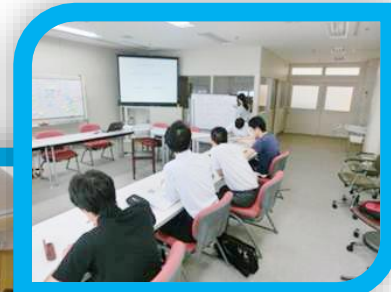
グループワークの一場面