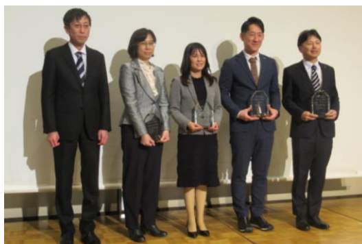
岡山労働局長 (医) 宝生会 名越産婦人科 御徳永こいのぼり 様 ダイヤ工業御 様 御キャリアプランニング 様

株式会社キャリアプランニング ダイヤ工業株式会社 株式会社徳永こいのぼり 医療法人宝生会 名越産婦人科