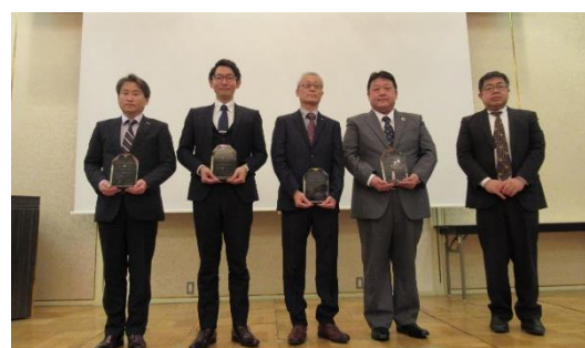
㈱ニッカリ様 山陽環境開発㈱様 木村スチール㈱様 ㈱アイダメカシステム様 岡山労働局長

株式会社アイダメカシステム 木村スチール株式会社 山陽環境開発株式会社 株式会社ニッカリ