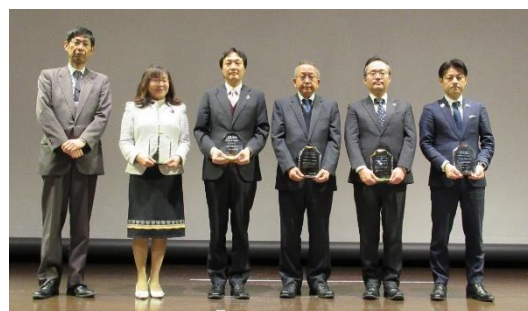
岡山労働局長 金田コーポレーション㈱様 ナガオ㈱様 日本キャストابل工業㈱様 ヤンマーアグリ㈱様 (旧ヤンマー農機製造㈱) WORK SMILE LABO 様

金田コーポレーション株式会社 ナガオ株式会社 日本キャストابل工業株式会社 ヤンマーアグリ株式会社 (旧 ヤンマー農機製造株式会社) 株式会社WORK SMILE LABO