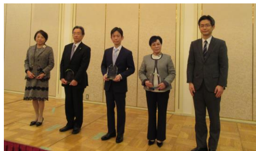
㈱フジワラテクノアート様 (一財)淳風会様 倉敷木材㈱様 ㈱英田エンジニアリング様 岡山労働局長

株式会社英田エンジニアリング 倉敷木材株式会社 一般財団法人淳風会 株式会社フジワラテクノアート