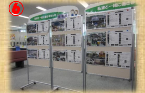
6 事業所写真情報コーナー 職員が訪問して撮影しています。応募の際のご参考にどうぞ！