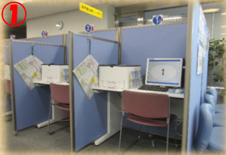
1 来所者端末コーナー パソコンを利用して、近隣のほか全国の求人情報を検索できます。