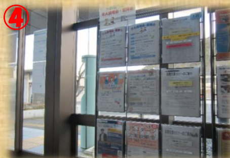
4 求人説明会・面接会のお知らせ