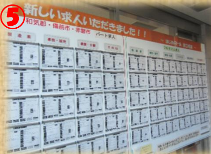
5 新しい求人いただきました！ 和気郡・備前市・赤松市 パート求人 子育て応援求人やシニア応援求人も掲示しています。