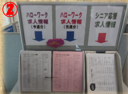
2 週間求人情報・シニア求人情報 ハローワーク和気・備前受理の最近1週間の求人一覧表です。庁舎外(玄関横)も置いています。