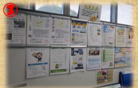
3 急募求人コーナー 特に採用を急ぐ事業所が独自に作成したチラシを掲示しています。