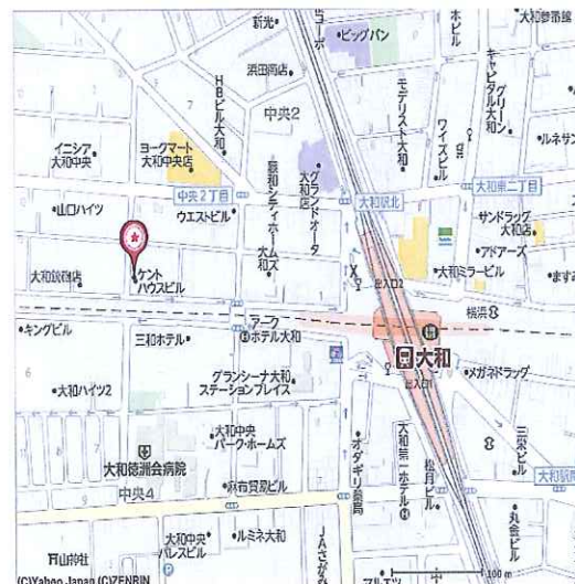
小田急線 相鉄線 大和駅より徒歩5分

給 与: 時間給、諸手当、有給休暇を含む総支給額 福 利 費 等: 健康保険、介護保険、厚生年金、雇用保険、労災保険、健康診断等 会社運営費: 人件費、オフィス、事務経費、募集広告費等会社運営にかかる諸経費 営 業 利 益: 上記経費を差引いた会社の利益