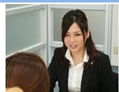
気になることがあれば何でもお気軽にご相談ください！