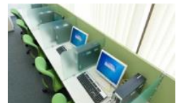
Word、Excel等のスキルアップ研修もご利用ください(無料)。