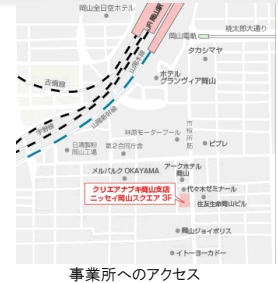
事業所へのアクセス