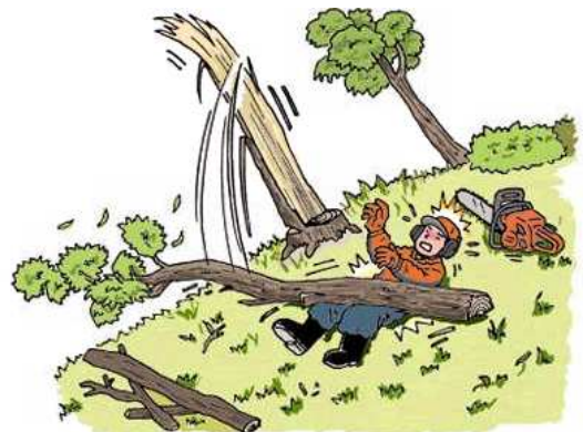
注意：イメージ図で実際の発生状況とは異なります。