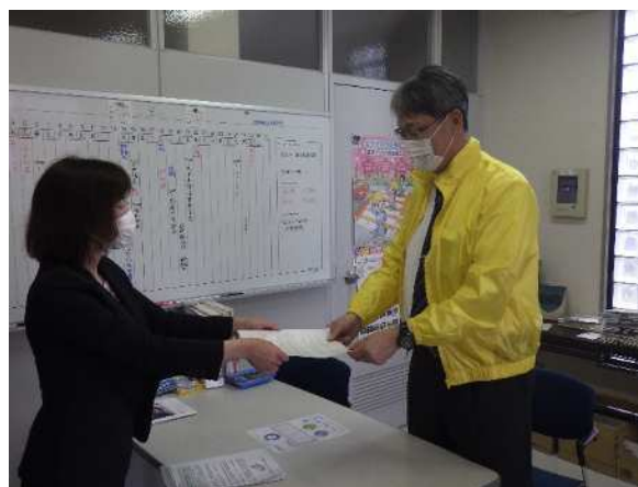
一般社団法人岡山県トラック協会備中支部

このような状況から、笠岡労働基準監督署管内の運輸交通業における労働災害の発生に歯止めをかけるため、一般社団法人岡山県トラック協会備中支部に対して、署長より、労働災害防止対策の強化にかかる協力を要請しました。（令和4年4月）