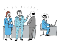
人間関係からの切り離し 隔離・仲間外し・無視