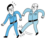
身体的な攻撃 暴行・傷害