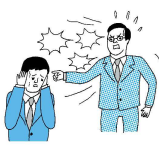
精神的な攻撃 脅迫・名誉棄損・侮辱・ひどい暴言