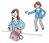
個の侵害 私的なことに過度に立ち入ること