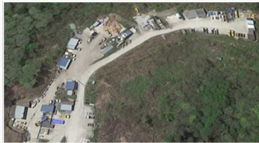
土橋クリーンセンター（中間処理施設）