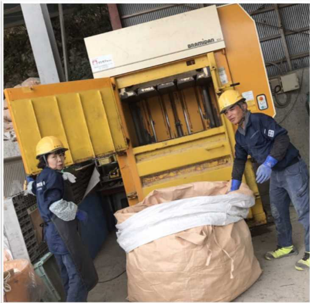
容器(ペットボトル)圧縮作業