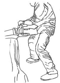
(図4) 下肢の切創防止用保護衣