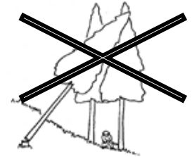
(図2) かかられている木の伐倒