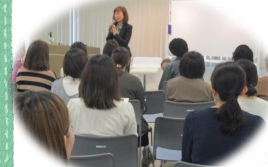
メイクアップセミナー

A. (失敗談)まだ駆け出しだった20代前半、お客様の意向を考えず自分が綺麗だと思うメイクをしてしまったこと。(成功談)成功することが当然の仕事ですが、メイクを喜んで頂けると私も幸せな気持ちになります。