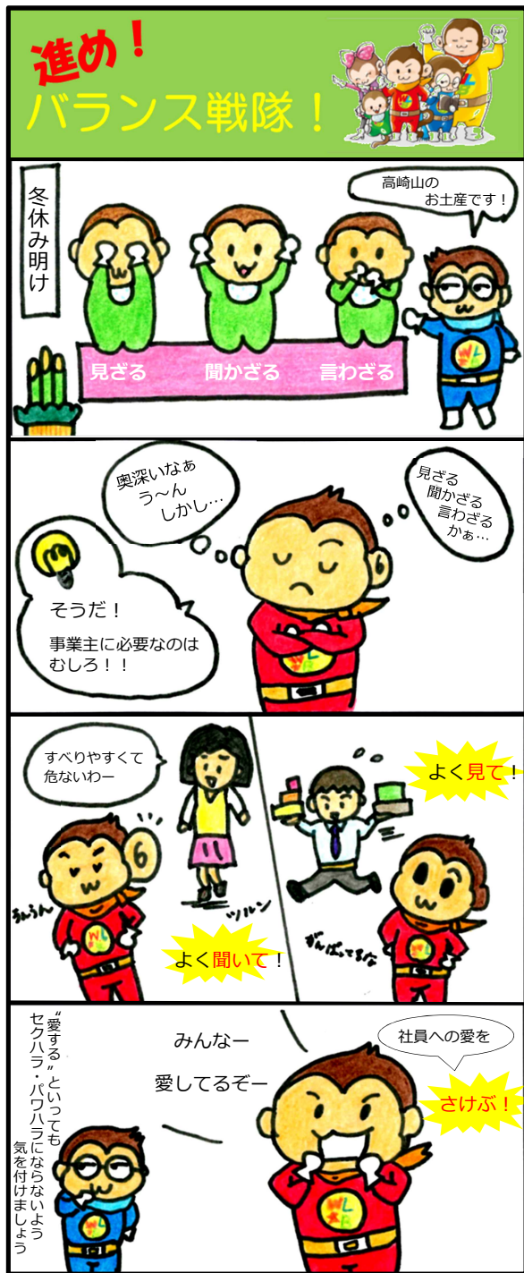
セクハラも せざる いわざる ゆるせざる