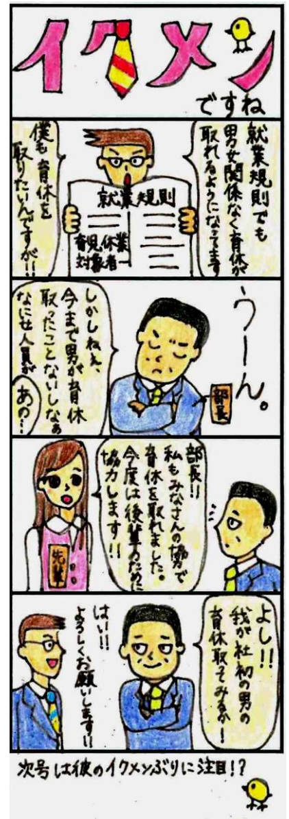
次号は彼のイクメンぶりに注目!?