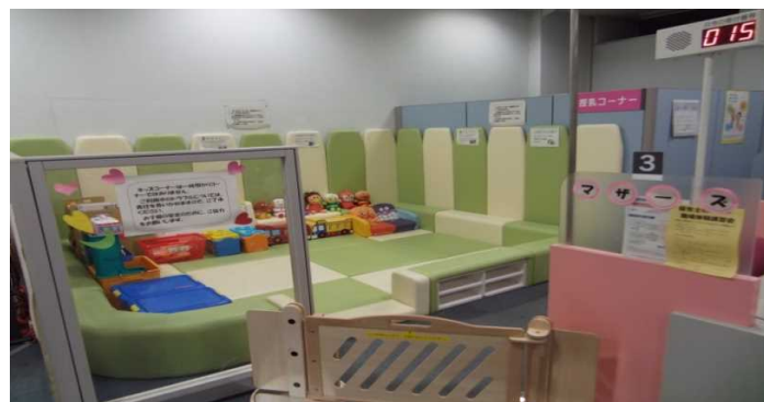
【キッズコーナー風景】

〒870-0029 大分市高砂町2-50 オアシス広場21 地下1階 電話: 097-533-6969 ご利用時間 平日 9:30~18:00まで ※マザーズコーナーは土曜日お休みです。