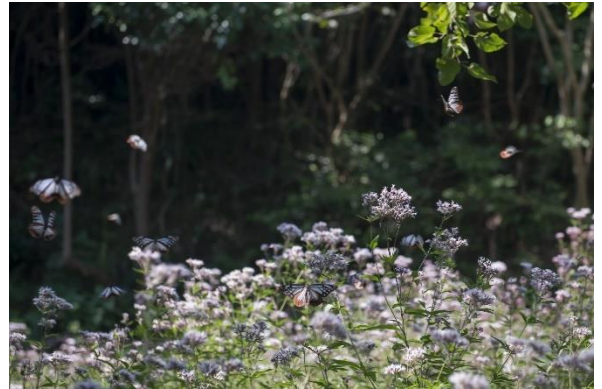
アサギマダラ(姫島村)