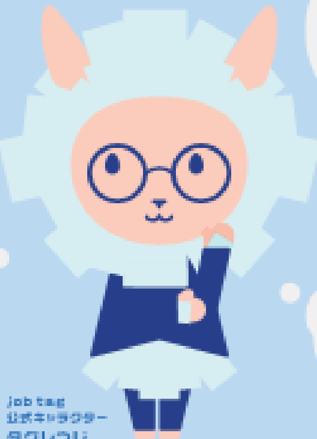
job tag 公式キャラクター タグしゅじ