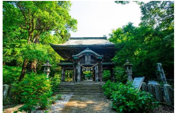
柞原八幡宮(大分市)